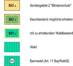
Wirksamer Flächennutzungs- und Landschaftsplans der Gemeinde Rückersdorf (o. Maßstab)

Aufgrund der geplanten Neuordnung der Nutzung ist eine Änderung des Flächennutzungsplans erforderlich. Parallel wird ein Bebauungsplan („Am Dachsberg“) aufgestellt.