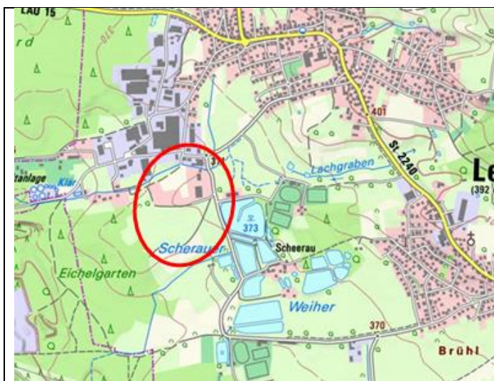
Lage im Geltungsbereich

Der Geltungsbereich der 1. Änderung des FNP (Änderungsbereich) liegt im Süden von Diepersdorf, südlich des dort befindlichen Gewerbegebietes an der Industriestraße. Der Änderungsbereich umfasst die Flurstücke Nr. 967 (tlw.), 967/2 (tlw.), 1038, 1039, 1040 (tlw.), 1041, 1042, 1043, 1043/2, 1044, 1045 (tlw.), 1045/1, 1046, 1046/2, 1047, 1048, 1049, 1049/2, 1051, 1052/1 und 1053 in der Gemarkung Diepersdorf. Der Änderungsbereich umfasst eine Fläche von ca. 7,7 ha.