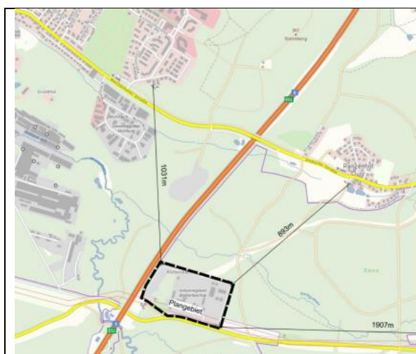
Lage des Plangebietes

Die geplante Baufläche ist im wirksamen Flächennutzungsplan der Stadt Röthenbach a.d. Pegnitz als Gewerbliche Baufläche gem. § 1 Abs. 1 Nr. 3 BauNVO dargestellt und bereits auf fast der gesamten Fläche baulich genutzt. Als Art der Nutzung wird ein Industriegebiet gemäß § 9 BauNVO sowie untergeordnet ein Gewerbegebiet gem. § 8 BauNVO festgesetzt.